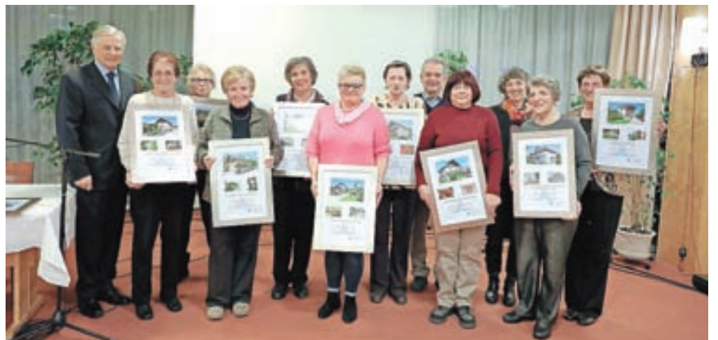
Prejemniki priznanj za lepo urejene hiše in vrtove