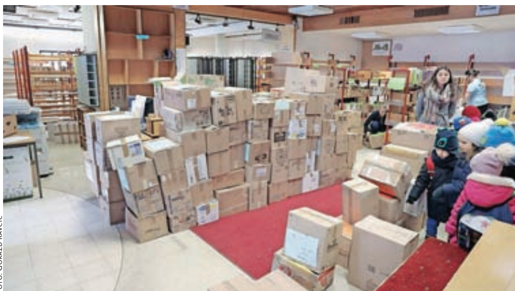
Takole so knjige, zložene v škatle, čakale, da jih prostovoljci odnesejo na nove police.