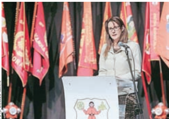
Slavnostna govornica, ministrica za obrambo Andreja Katič

Ob okrogli obletnici je zveza izdala tudi zbornik, v katerem je opisano delo od ustanavljanja gasilske zveze do danes ter predstavljenih vseh 14 prostovoljnih gasilskih društev, ki delujejo na območju občine Radovljica.