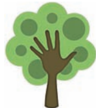
Očistimo našo občino - Radovljica 2018

OŠ F. S. Finžgarja Lesce je čistilno akcijo z učenci že izvedla. Učenci OŠ Staneta Žagarja se bodo jutri pridružili na zbornih mestih v posameznih krajevnih skupnostih, območje šole pa so