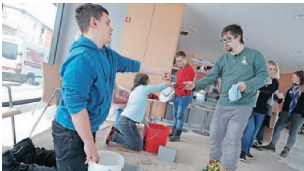
Učenci OŠ Antona Janše so pomagali v novi knjižnici na Vurnikovem trgu.